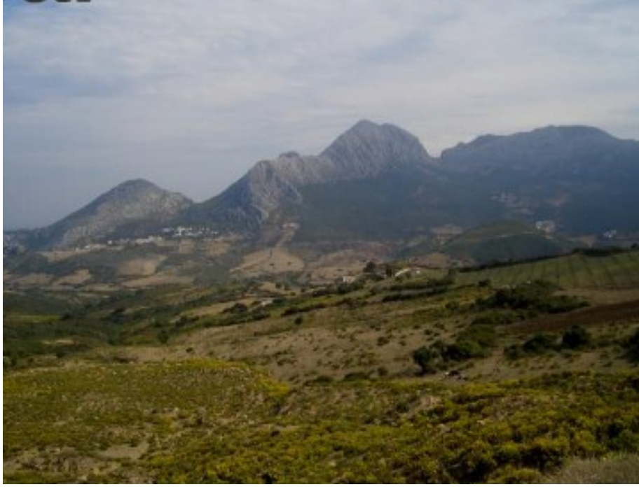
سهل واد مرسى

ثراء المحيط البيئي، والآثار والبيوت الملونة تجعل المنظر الطبيعي أكثر جاذبية