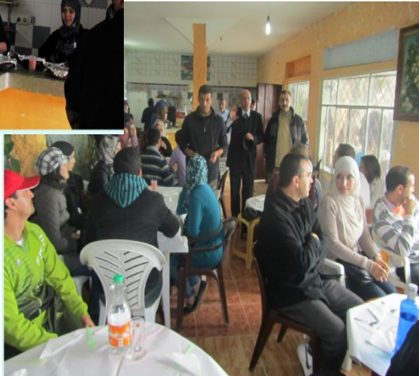
مطعم شعبي في بليونش