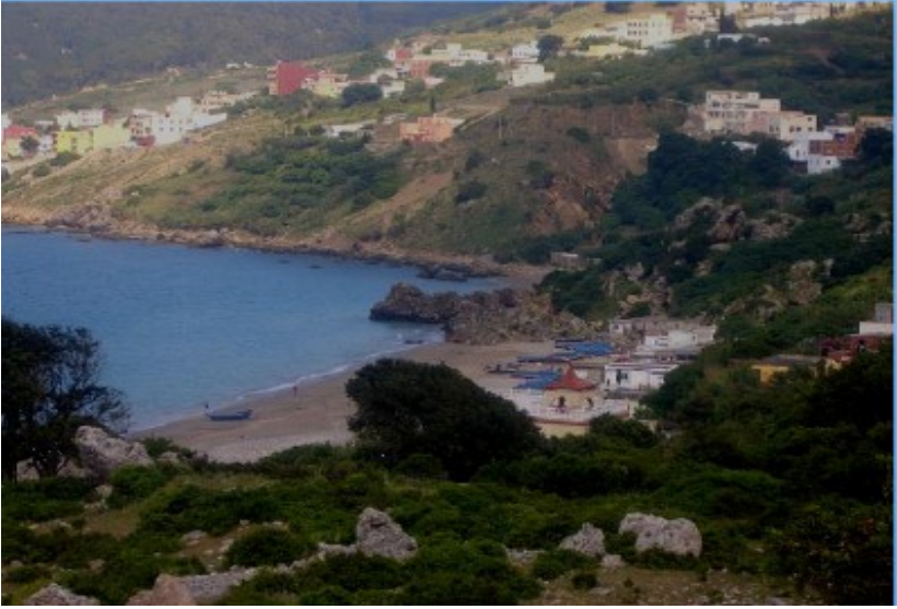
الوسط الحضري في ساحل بليونش

تعد الشواطئ من المقومات السياحية وتوفر فوائد أخرى على مستوى الصيد التقليدي.