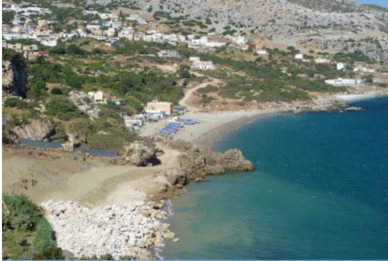
منطقة الصيد ببليونش