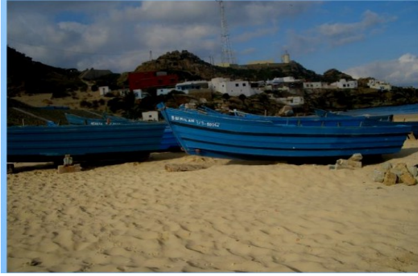
قوارب الصيد في شاطئ الدالية