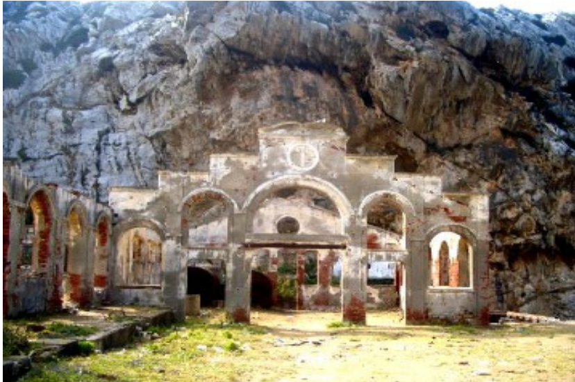
المصنع القديم لقوارب صيد الحيتان