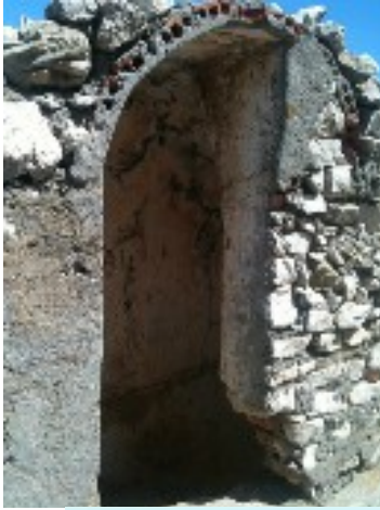
أنفاق في رأس ليونا