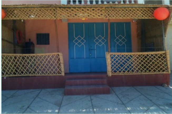
مطعم في شاطئ واد مرسى