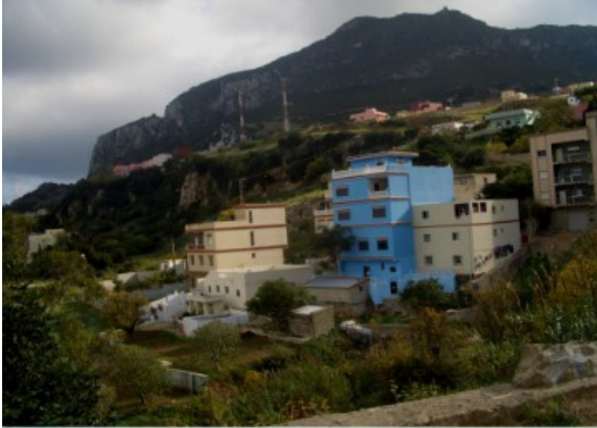
بيوت في بليونش