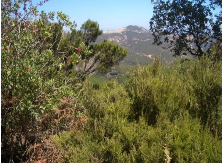
الغابة النهرية في واد مرسى.