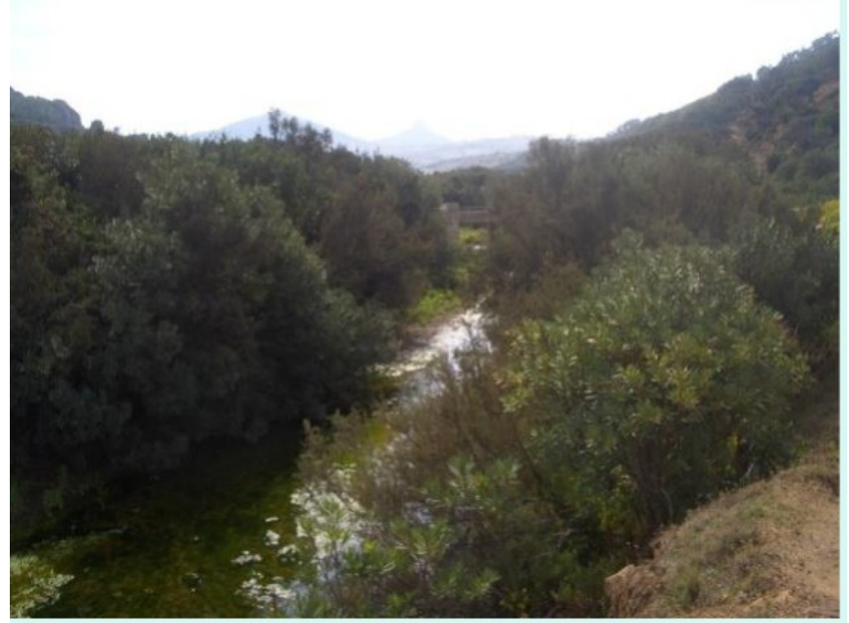
غابة في إمزالا