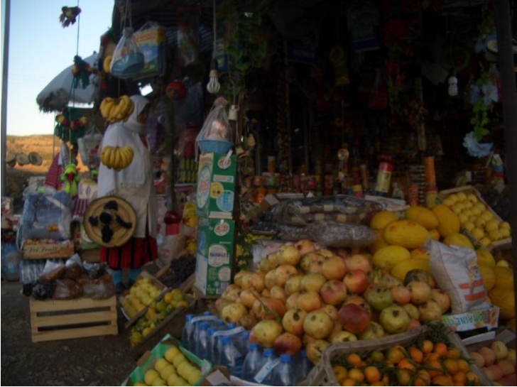
Magasin local de produits frais et emballés.

Éviter les emballages individuels ou à usage unique, en les substituant par d'autres réutilisables. Éviter les produits en plastique fabriqués avec PVC.