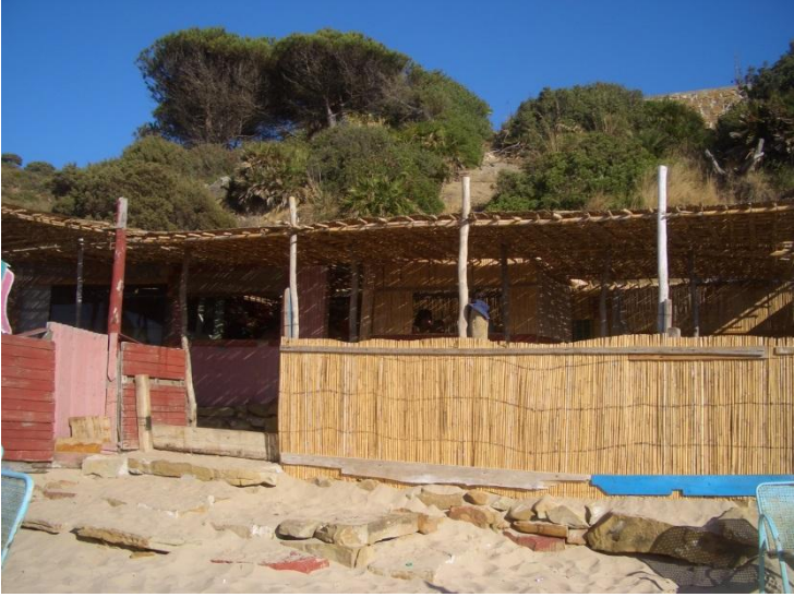
مقهى ملتصق بالشاطئ مركب من مواد طبيعية.

تقديم مجهود قصد التقليل من استعمال الماء، نظرا لندرة هذا المورد القيم، بواسطة تشكيلات للتوفير، فاعلة في التنظيف، والقيام بتتبع استهلاك الماء. تقديم نفس المجهود بالنسبة لاستهلاك الطاقة، وتشجيع استعمال الطاقات المتجددة (مثل اللوحات الشمسية).