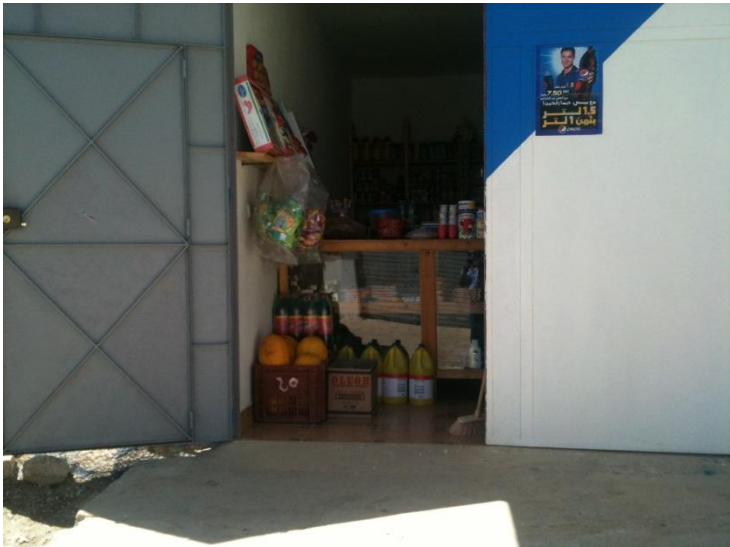
Establecimiento local de comestibles.

Usar los servicios y productos de pequeñas o medianas empresas locales, sobre todo las de carácter sostenible. Promocionar los servicios y productos locales entre los clientes.