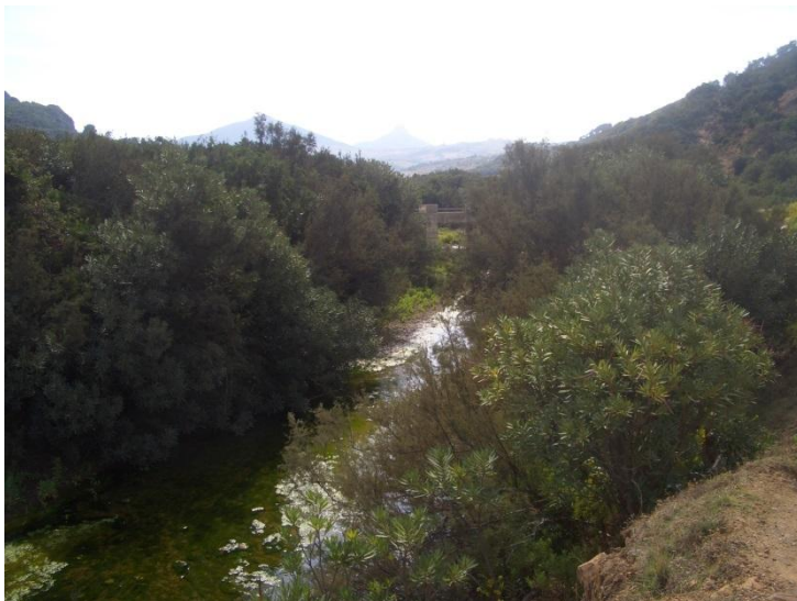
Rivière à préserver en utilisant des produits respectueux de l'environnement.

Remplacer les produits toxiques de nettoyage par des produits écologiques et biodégradables. De cette façon on évite que l'eau de nettoyage soit polluante.