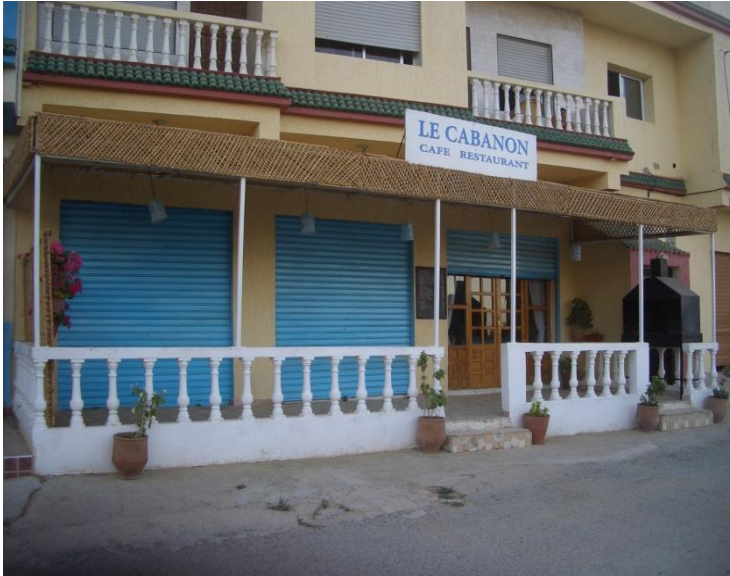
مؤسسة فندقية لها شرفة

تنظيم الأماكن المكيفة بحيث يمكن إقفال الأماكن التي توجد فارغة.