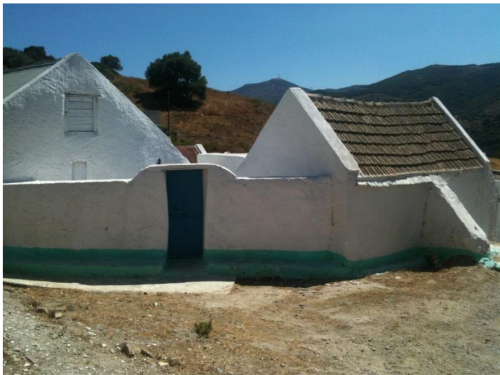
Construcción de tipología tradicional con muros blancos para evitar la absorción de calor.

Asegurar que cada zona tenga una iluminación acorde a sus necesidades y aproveche la luz natural, tener en cuenta esto también en el diseño de los establecimientos (uso de tragaluces, colores claros en paredes, etc.).