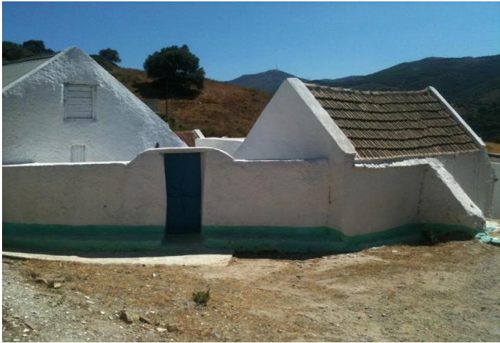
بنية من النوع التقليدي حيطانها مطلية بالأبيض لتجنب امتصاص الحرارة.

إمساك سجل شهري لاستهلاك الطاقة حسب نوعها (غاز، غزوال، بوطان، كهرباء، الخ)، وحسب استعمالها (إنارة، تدفئة، مطبخ، الخ)، وحسب ثمنها، بهدف معرفة الفعالية في استهلاك الطاقة.