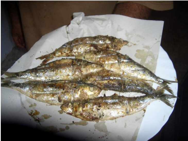
Plato de sardinas asadas realizado con materias primas procedentes de la pesca local.

Evitar el consumo de productos de especies pesqueras en veda o inmaduros, no garantizan calidad ni frescura y pone en peligro la estabilidad pesquera.