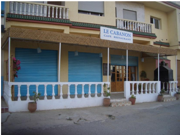
Establecimiento hostelero con terraza.

Organizar las áreas climatizadas para poder cerrar aquellas que se encuentren desocupadas.