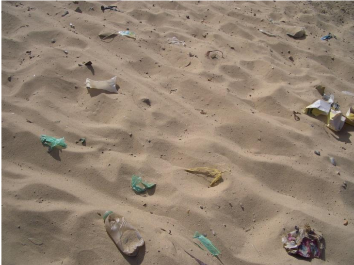
Plage avec des déchets laissés par les touristes et visiteurs.

Respectez les signalisations des sentiers.