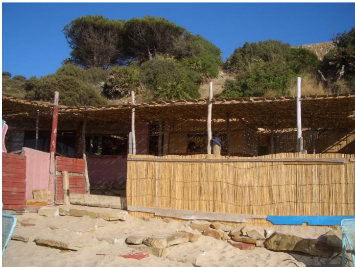
Chiringuito (Restaurant) au pied de la plage construit avec des matériaux naturels.

Maintenir les installations en parfait état et adopter des critères durables dans l'entretien, dans les mesures d'amélioration, de réhabilitation et de construction, aussi bien pour les nouvelles installations que pour les anciennes. Prioriser l'usage de matériaux naturels, autochtones et recyclables en intégrant la construction dans l'environnement.