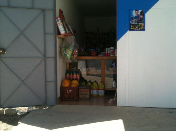
دكان محلي لبيع المواد الغذائية

استعمال الخدمات والمنتجات للمقاولات الصغرى والمتوسطة، خاصة ذات الطابع المستدام. إنعاش الخدمات والمنتجات المحلية بين الزبائن.