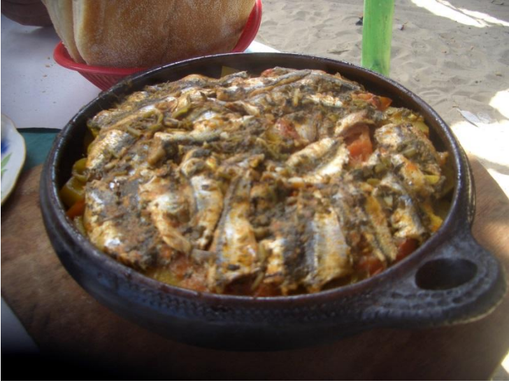
القدور التقليدية هي أواني ذات الشروط الملائمة لحفظ الحرارة وتحسين مذاق الأطعمة

استعمال أواني ذات غطاء يسوى لأجل حفظ الأطعمة عوض أوراق الألمنيوم أو البلاستيك.