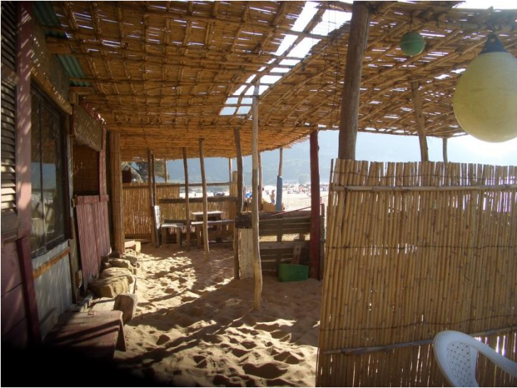
Terraza de chiringuito con techado para dar sombra, construida con materiales naturales.