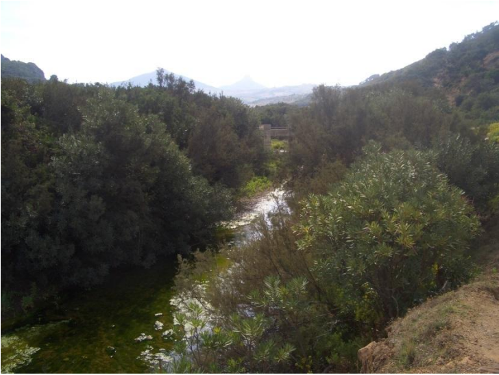
وادي يجب الحفاظ عليه، باستعمال منتجات محترمة.

يجب استبدال المنتجات السامة الخاصة بالتنظيف، بمواد إيكولوجية أو ومندثرة بيولوجيا. بهذه الطريقة، نتجنب أن يكون ماء التنظيف ملوثا.